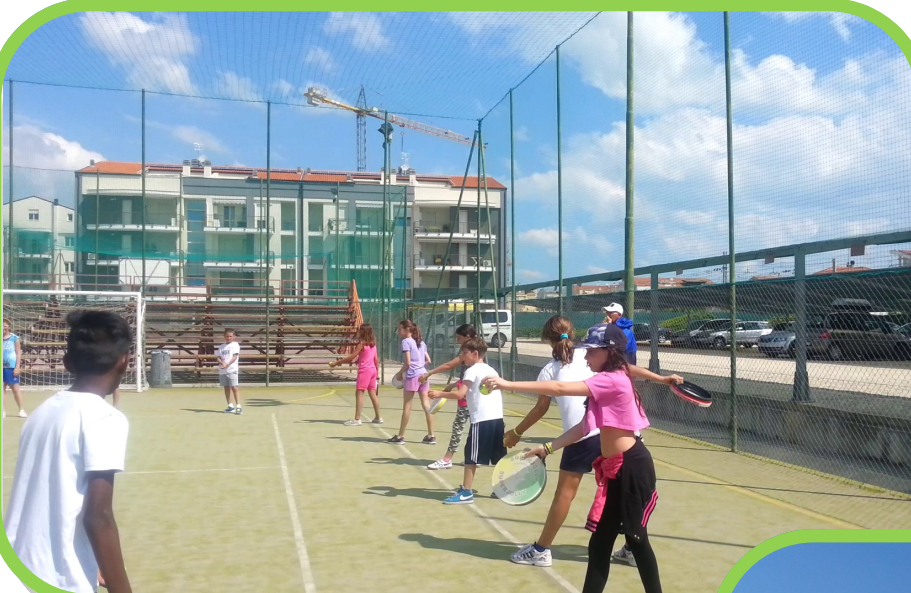
Preparazione del tamburello

spiaggia abruzzese infatti ha assunto la forma di un groviera tra scavi, gallerie e sottopassaggi costruiti dalla famigerata ditta "Giococamp&Co"