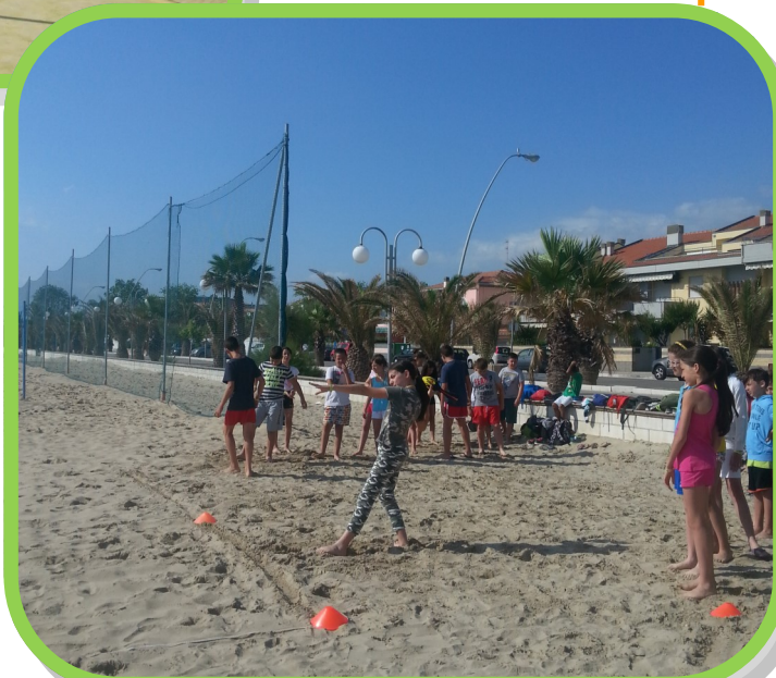
Vortex in spiaggia